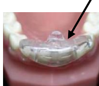
Protège-dents inférieur couvrant toutes les dents

Le protège-dents inférieur partiel est accepté pour les personnes portant un appareil dentaire UNIQUEMENT sur les dents du haut .