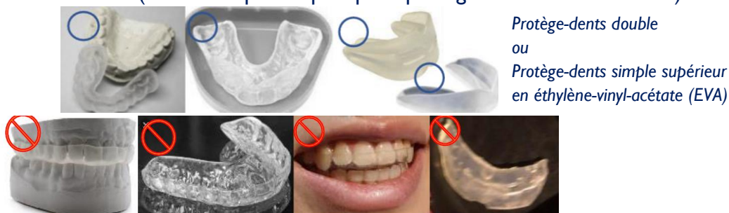
Protège-dents double ou Protège-dents simple supérieur en éthylène-vinyl-acétate (EVA)

Remarque : L'athlète ne peut pas porter un protège-dents orthodontique (gouttière dentaire) pour remodeler la position des dents (ils ne sont pas adaptés pour protéger les dents en combat).