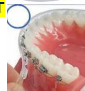
Gouttière dentaire pour le bas + avis médical