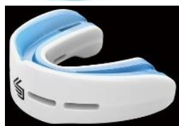
Protège-dents double blanc ou transparent ET incolore