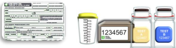
Formulaire et kit pour le recueil des urines lors d'un contrôle inopiné

Beaucoup de substances sont interdites telles que les hormones, les bêtabloquants, certains médicaments... La détection étant délicate, le laboratoire d'analyse recherche à la fois des substances non autorisées mais également des substances qui visent à camoufler leur présence comme des diurétiques facilitant l'élimination des produits ou des agents masquants.