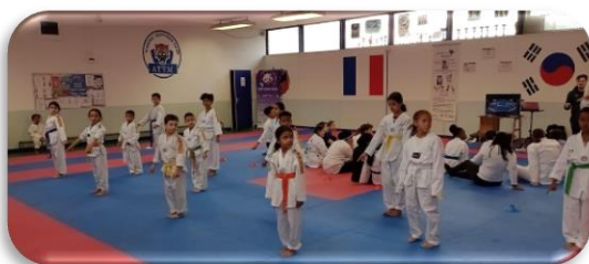
Merci à Kawthar IMAM pour le relais des informations et les photos

Ce même week-end, la ligue CVL proposait à Tours, lors d'un stage de ligue autour du combat et de la technique, une animation sur le thème de l'arbitrage.