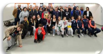
Merci à Pras pour l'article rédigé et les photos

Au programme : réglementation, analyses de vidéos, les règles et leurs histoires, gestuelles et travail spécifique des juges de coin avec manettes en situation réelle.