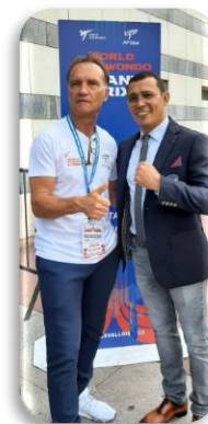
ici avec le boxeur Brahim Asloum

La collaboration au Grand Prix Para a été l'occasion de découvrir d'autres types de combats « étonnants et de très bons niveaux ». Cela permet de prendre de la perspective à travers l'humilité, la résilience et l'abnégation dont font preuve ces athlètes.